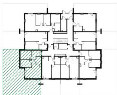
położenie mieszkania w budynku