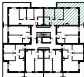
położenie mieszkania w budynku