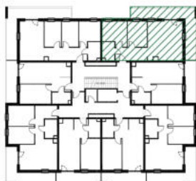
położenie mieszkania w budynku